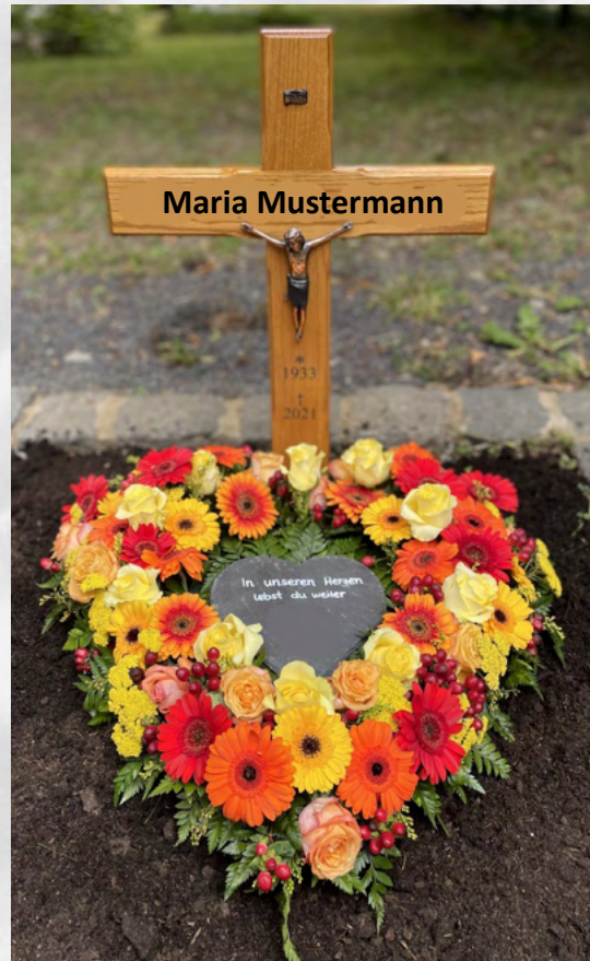
Katholisches Grabkreuz mit Christuskörper und INRI