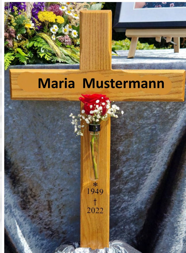
Evangelisches Grabkreuz / Christliches Grabkreuz mit Blumenvase